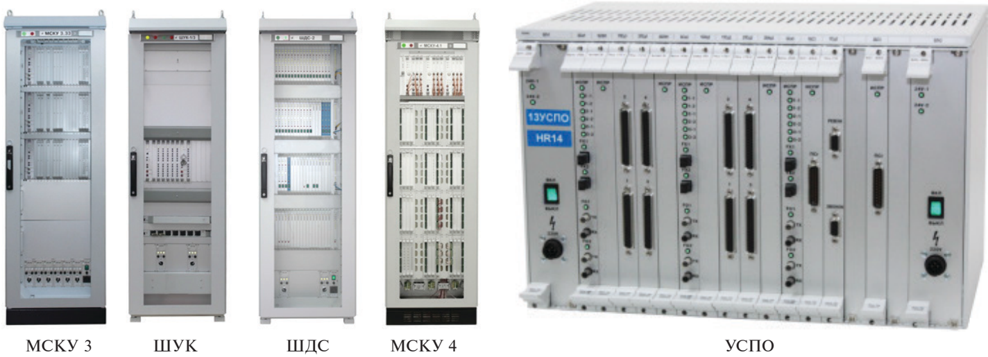
Рис. 2. Внешний вид базовых компонентов ПТК УСБТ и ПТК УСНЭ